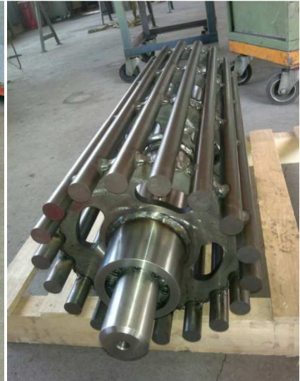
vor dem konisch Überdrehen

Stabtrommel konisch überdreht für den optimalen Gurtlauf (selbstzentrierend) Kein Materialaufbau (selbstreinigend), kein Trommel- und Pflugabstreifer nötig. Kein Verstopfen und kein Festfrieren im Winter.